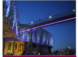
MC2 GRENOBLE – SCÈNE NATIONALE