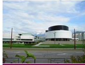
MAISON DES PRATIQUES ARTISTIQUES AMATEURS (MPAA)